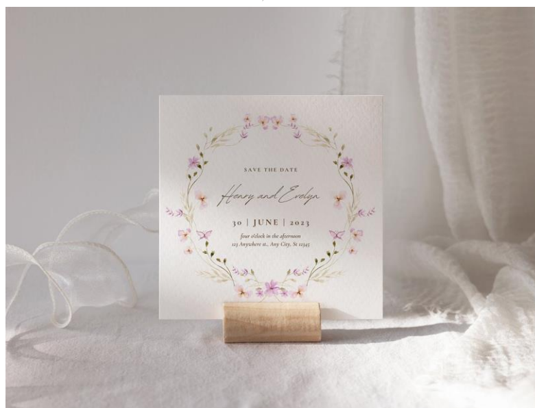
Card tableau da appoggio 2* 1,00