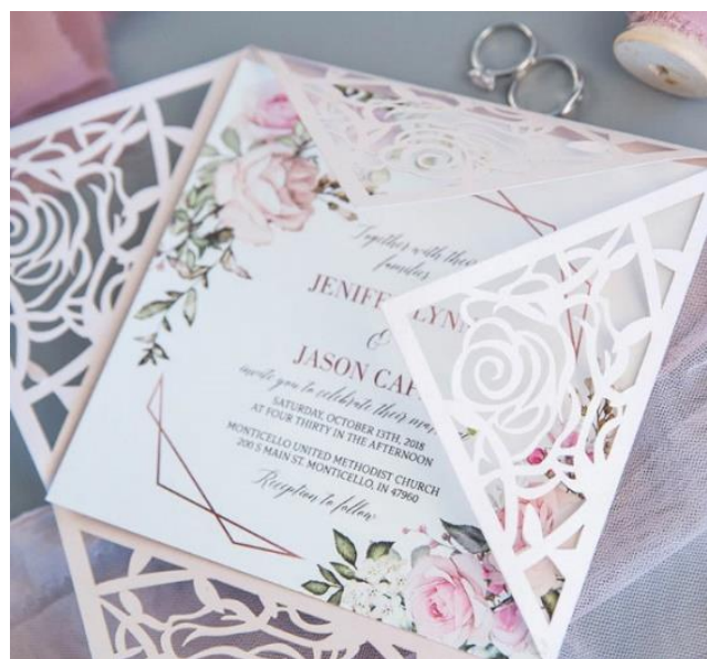
Modello 11* 4.00