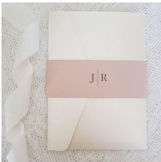
Fascetta chiudi busta +0,70