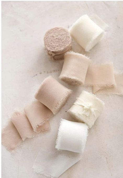
Nastro in seta + 1.00