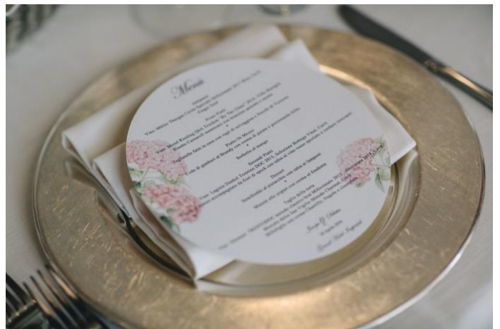
menù tondo 2,00