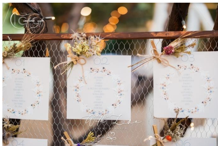
Card tableau 1,00