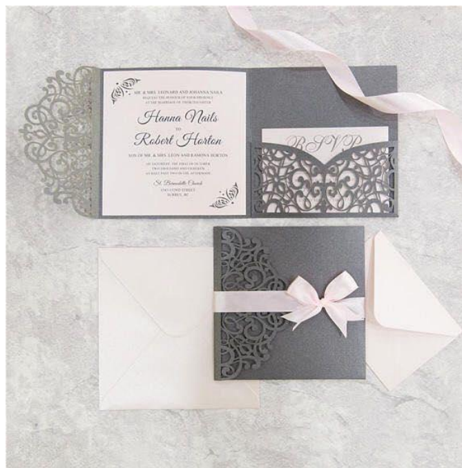
Modello pocketfold 5* 4,50