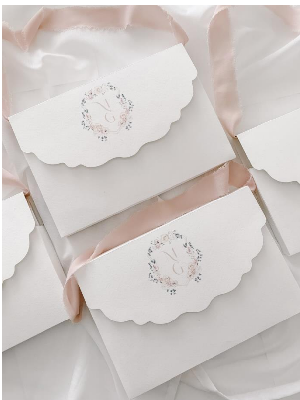
Wedding bag 9,50