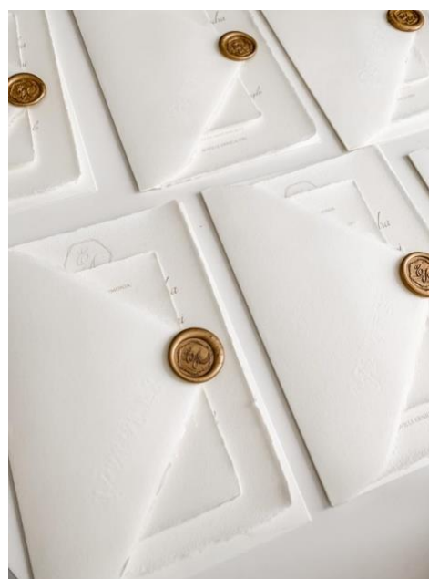
Modello classico con singolo cartoncino + ceralacca + busta 5,50 €

COSTO FISSO PER LA STAMPA SOLO su carta Amalfi 50 € da aggiungere al totale