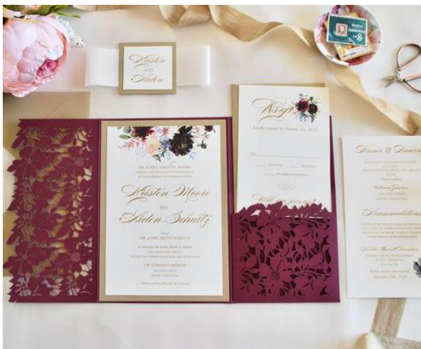
Modello pocketfold 8* 450