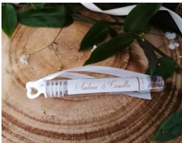
Bolle di sapone 1,00