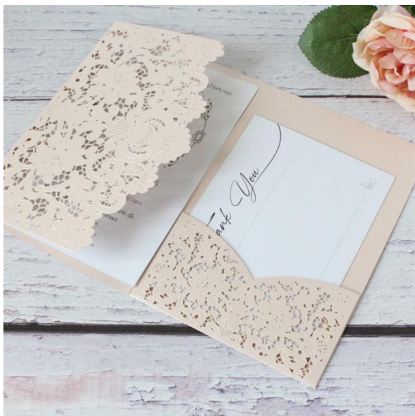
Modello pocketfold 2* 4,50