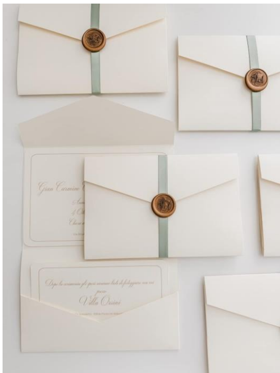
Modello pocketfold con ceralacca e nastro in raso 5-70