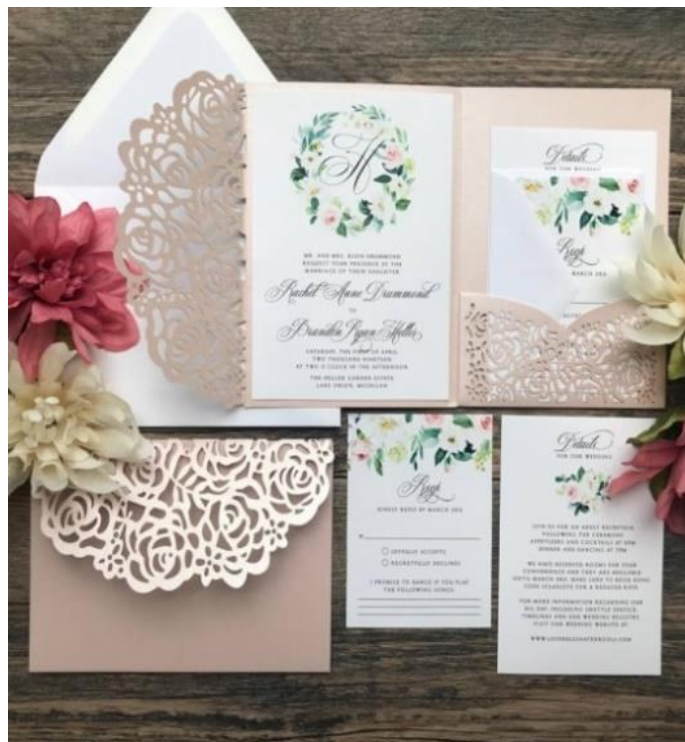
Modello pocketfold 4* 4,50