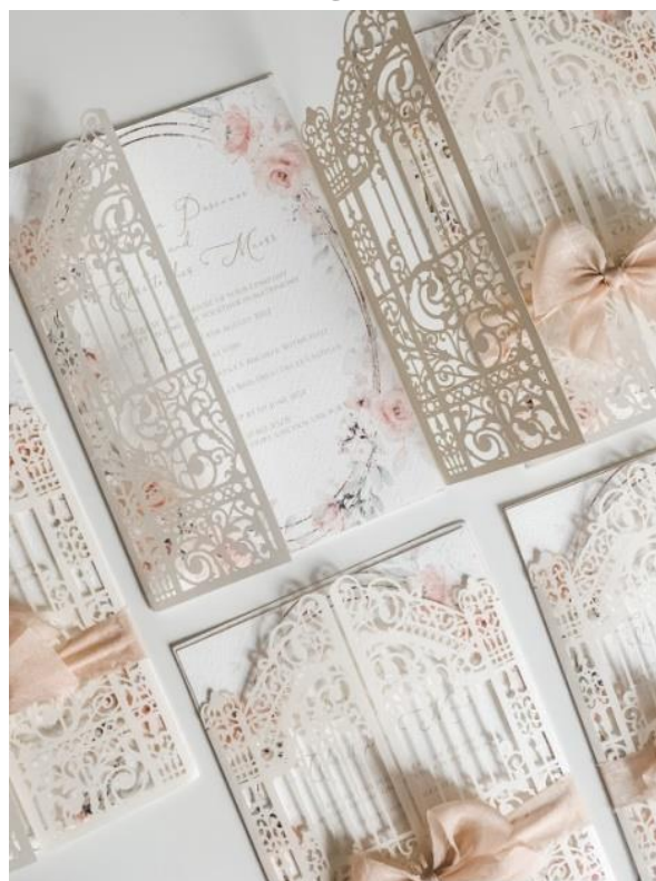
Modello rettangolare 1*