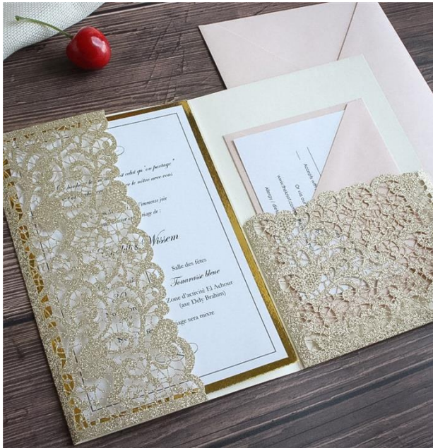
Modello pocketfold 6* 5.00