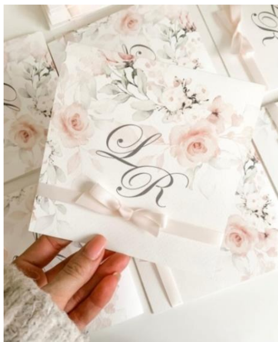
Modello quadrato con apertura a libro + busta bianca 3.40 stampa fronte - retro