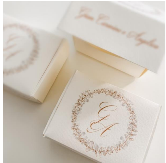
Astuccio portaconfetti 2,00