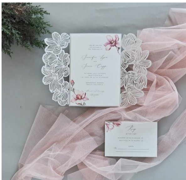
Modello rettangolare 7* 3,50