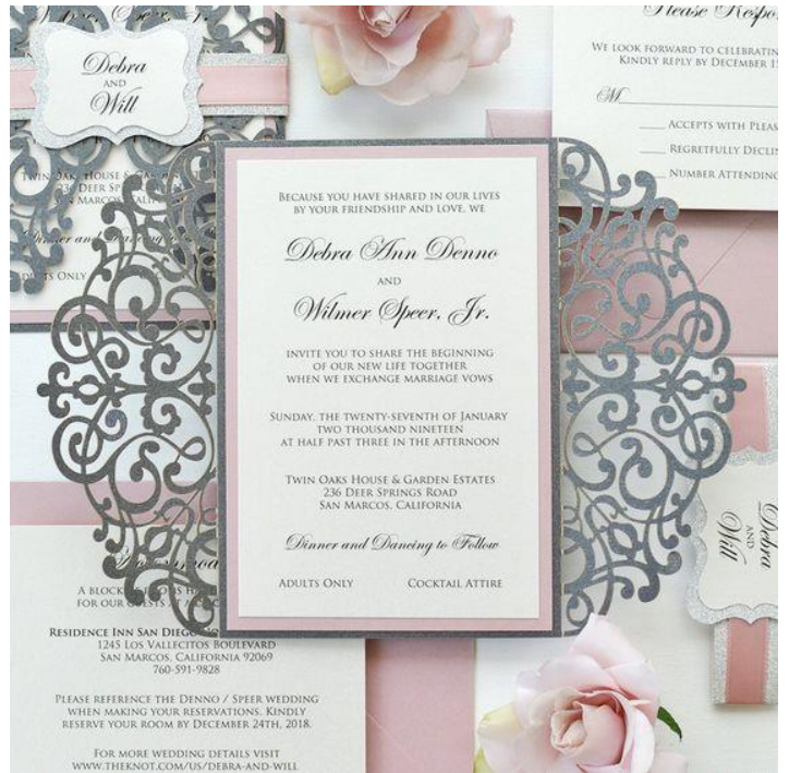
Modello rettangolare 9* 3,50