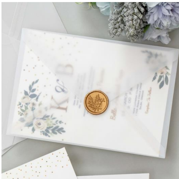
Modello classico rettangolare con busta semitrasparente + ceralacca 3,30