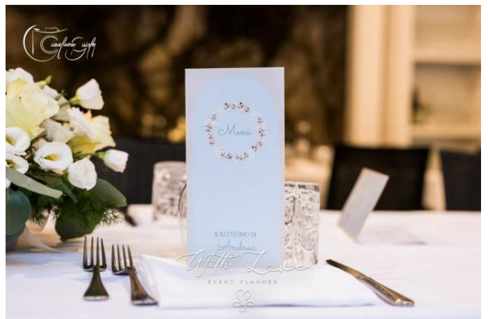
Menù tavolo a5 2.50