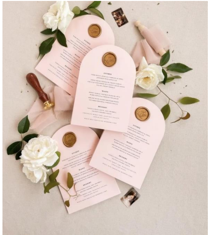
Menù personalizzato con ceralacca 2,70