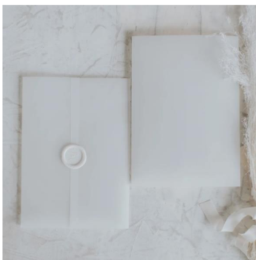
Copertina traslucida bianca o stampata 0,90