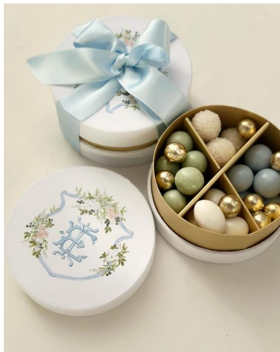
Box tonda in cartone rivestito con stampa digitale 5,50