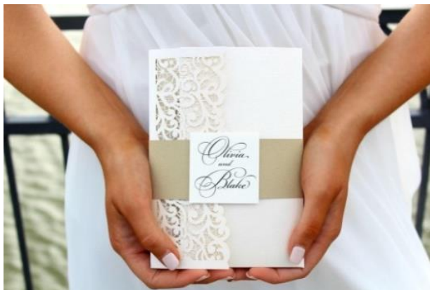
Modello pocketfold 1* 5,00