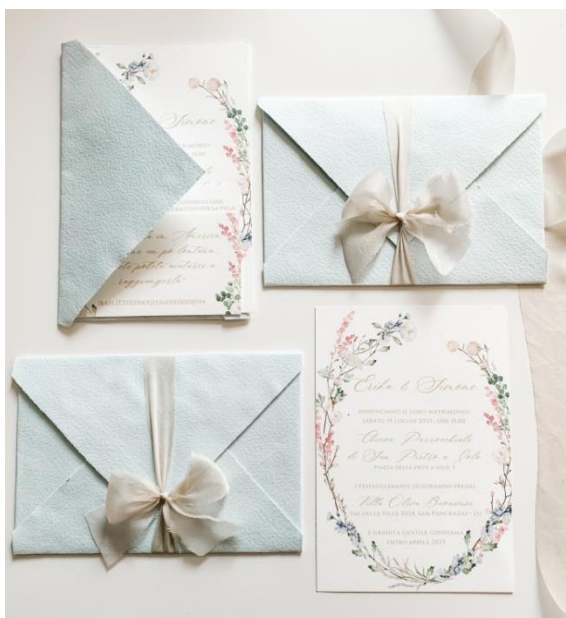
Modello artigianale con busta in carta cotone artigianale e nastro in seta 4,20