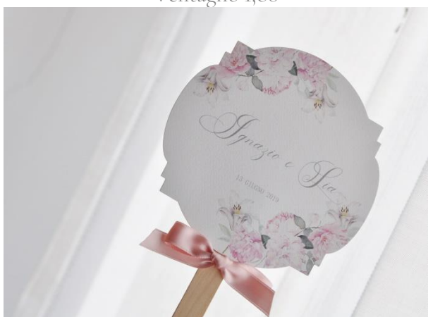
Ventaglio paletta (Realizzabile in qualsiasi forma) 2,00