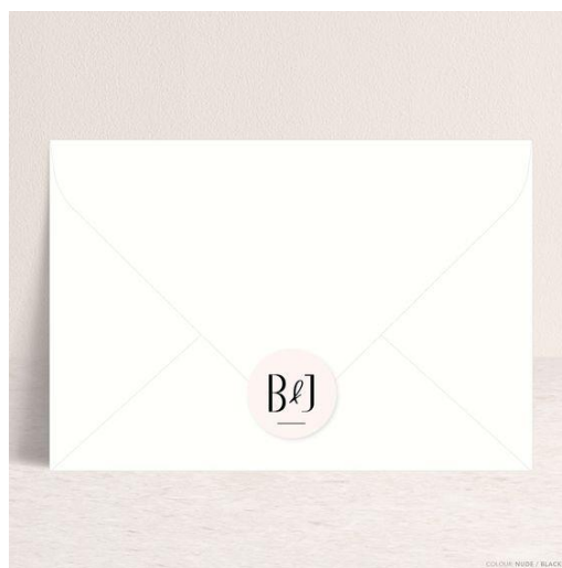
Adesivo chiudi busta +0,50