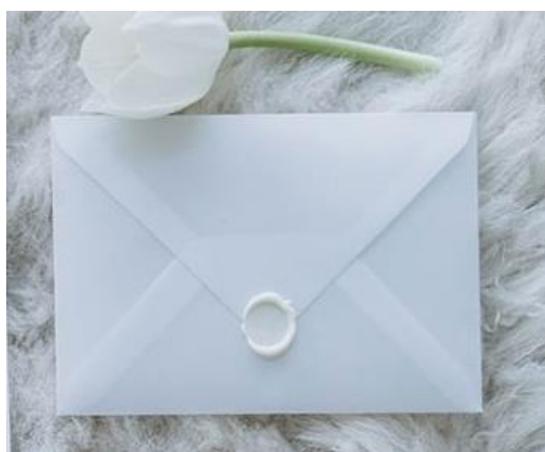
Busta semitrasparente 0,90