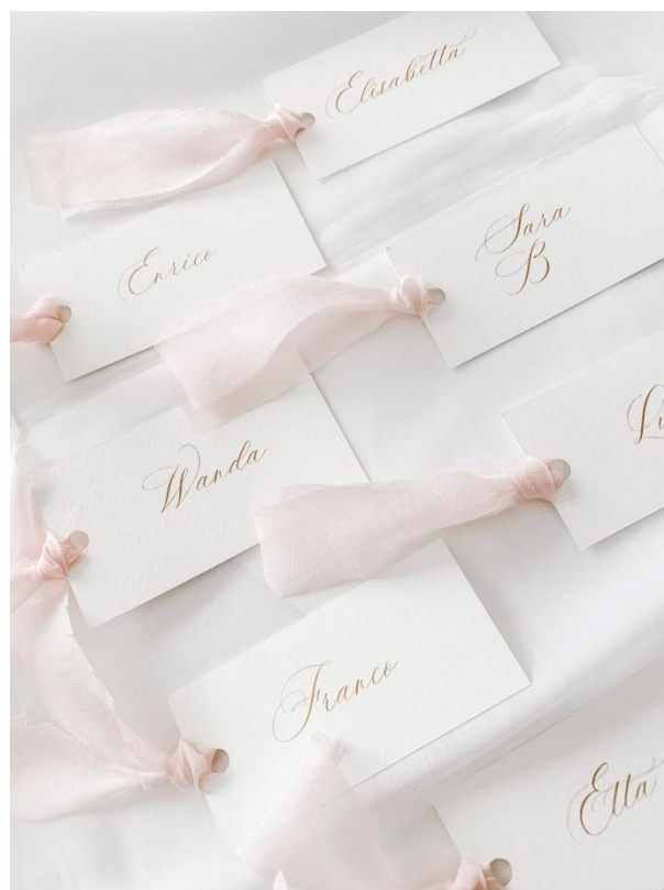
Segnaposto con seta 2,00