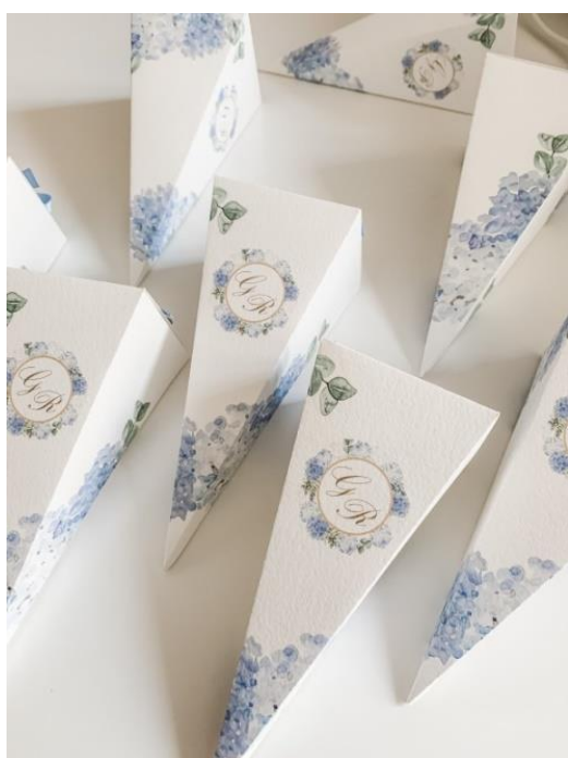
Cono portaconfetti 1,50