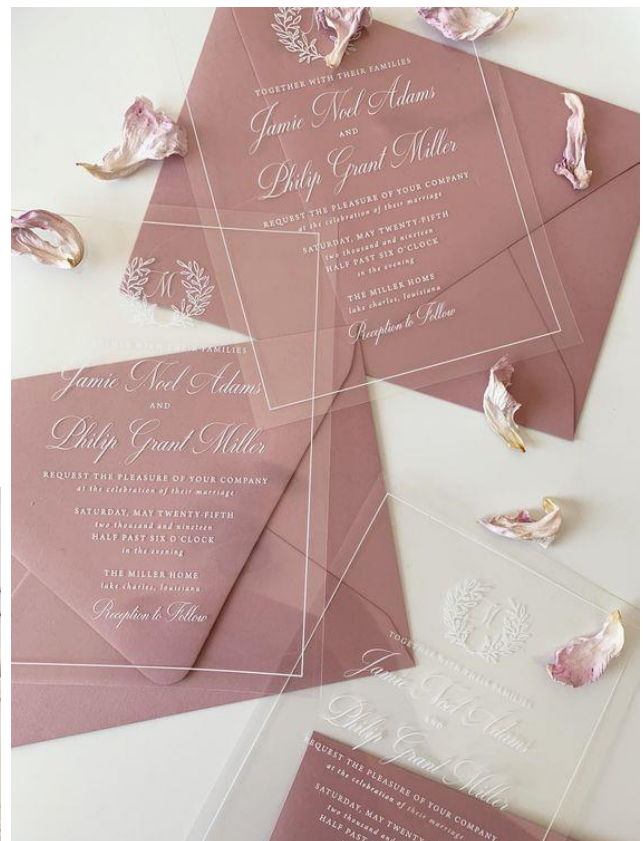
Partecipazione in plexiglass con busta colorata 8.00