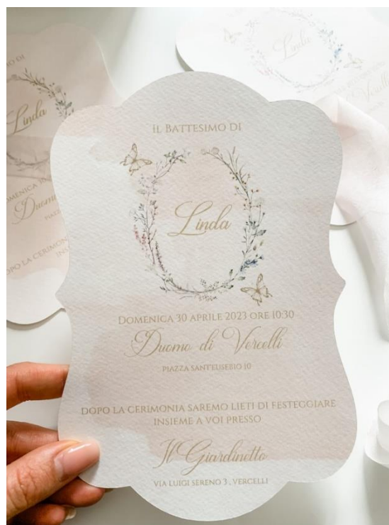
Modello sagomato 2.90 con busta