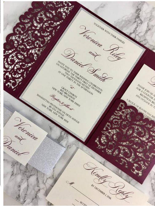
Modello pocketfold 9* 4.50