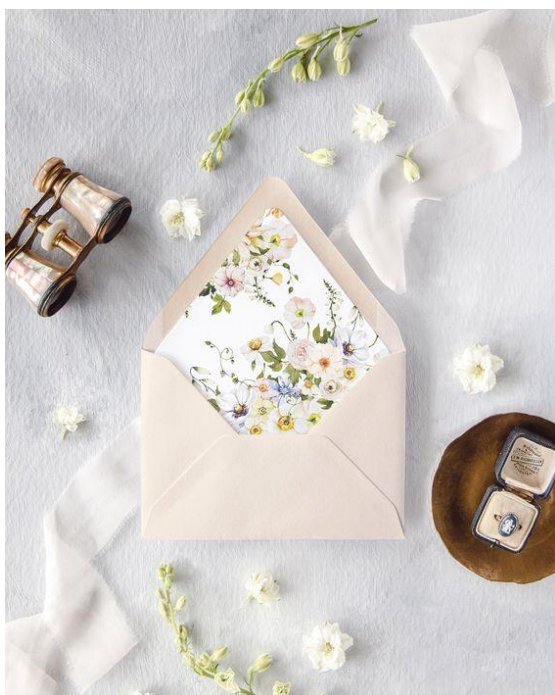
Liner busta 1,00/1,50