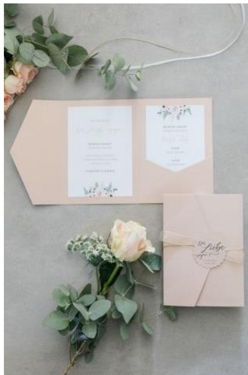
Busta pocketfol 2.50