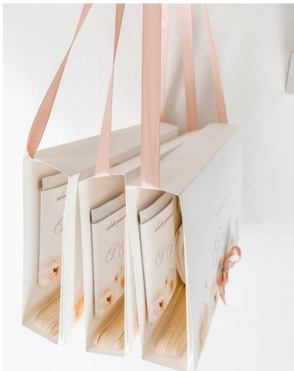
Wedding bag modello pochette 7,00