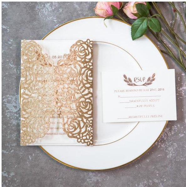
Modello rettangolare 6* glitterato