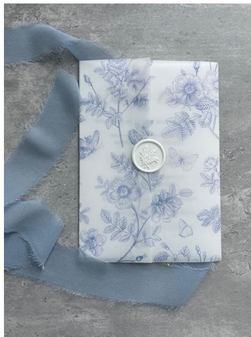
Modello classico rettangolare con vellum stampato + ceralacca 3,30