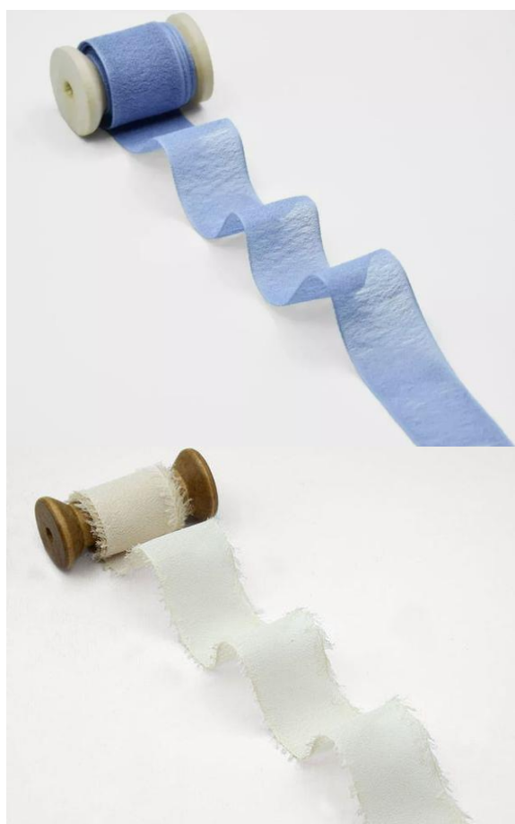
Nastro crèpe + 1,30