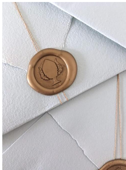
Cordino in seta +0.80