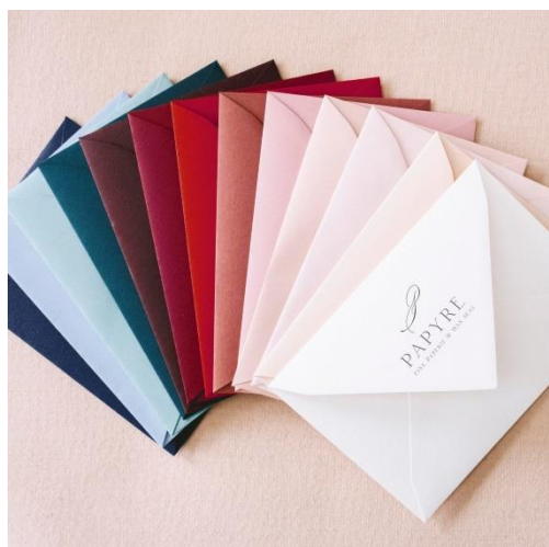
Buste colorate 1,30