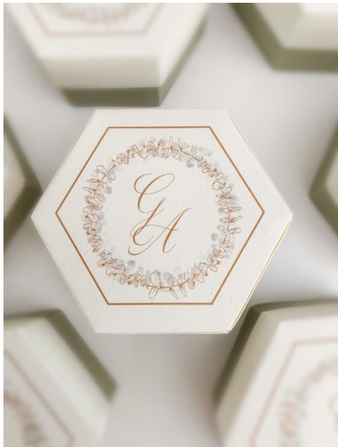
Scatolina esagonale 2,50