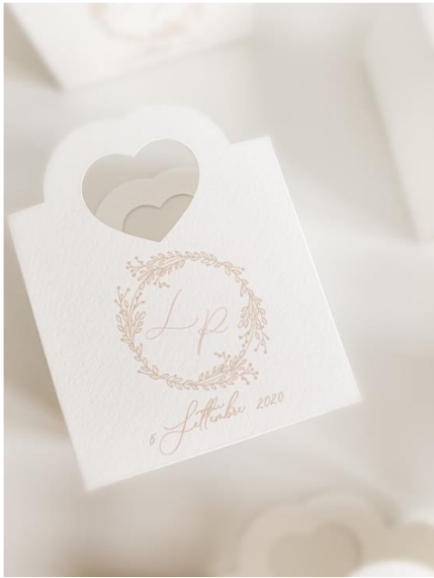
Bustina cuore confettata 1,50