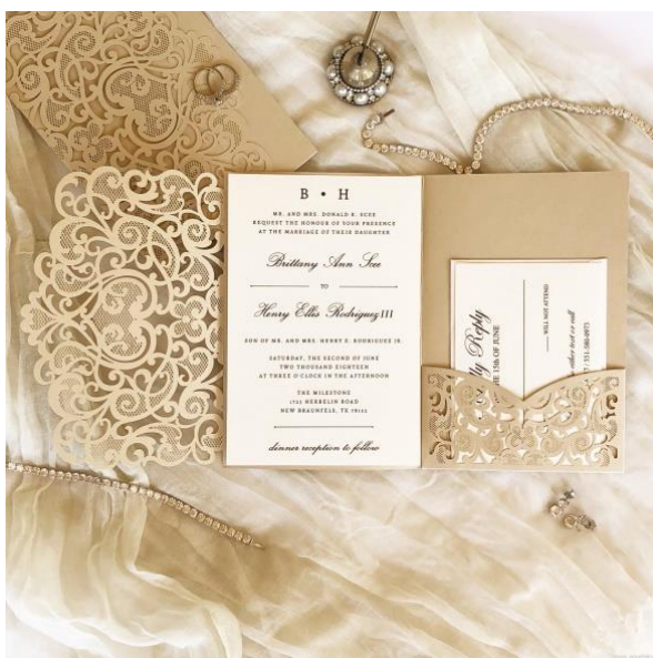
Modello pocketfold 3* 4,50