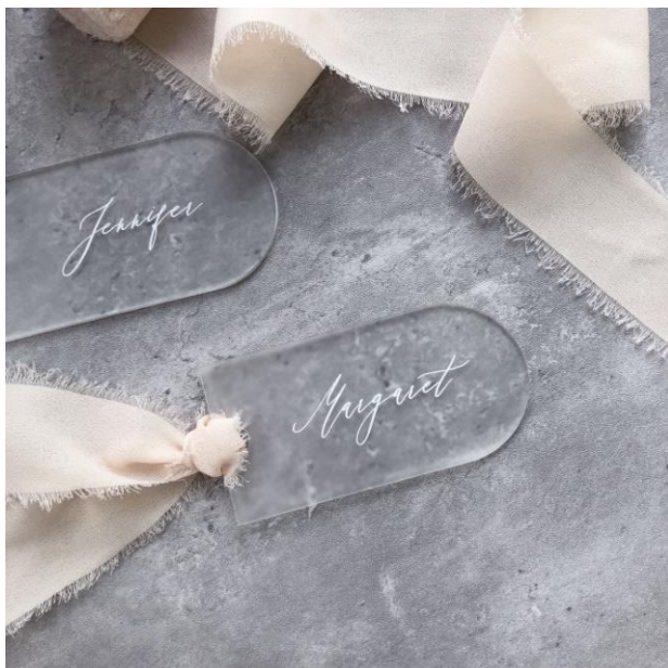
Segnaposto plexi 3,50