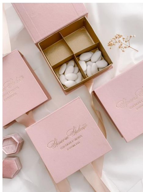
Scatola quadrata rivestita 6,00 13x13 cm (stampa a caldo +50€)