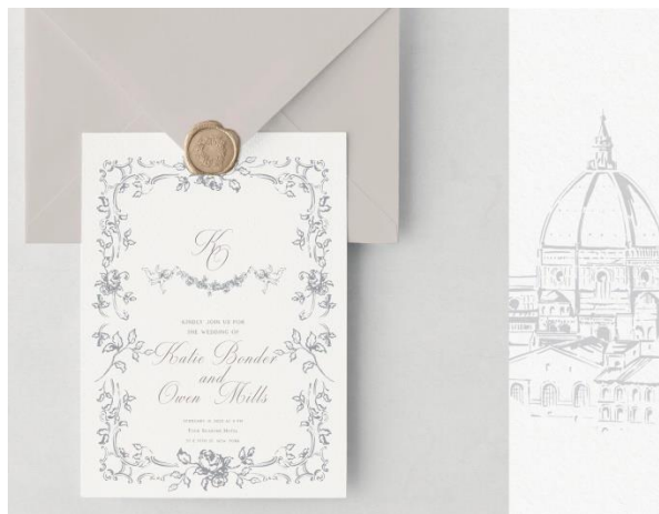
Modello classico ad unico cartoncino con ceralacca personalizzata 3.70

Potete scegliere ad esempio di usare il design di un modello, e mixarlo con elementi di un altro modello da catalogo.