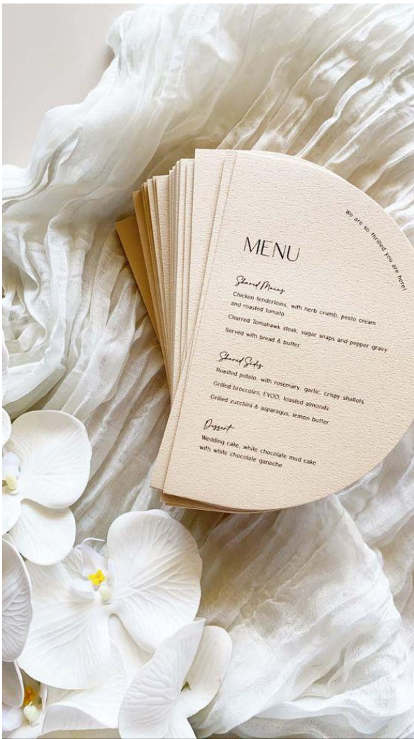
Menù posto singolo mezzaluna 1,50