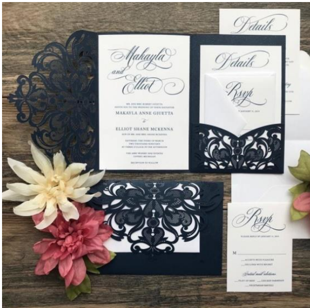
Modello pocketfold 7* 4.50