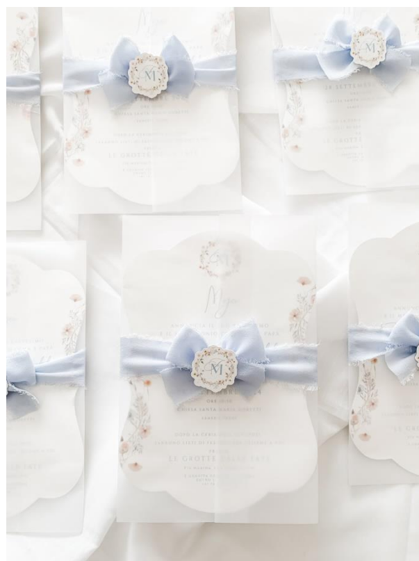
Modello sagomato con guscio in vellum + nastro in seta 3.60