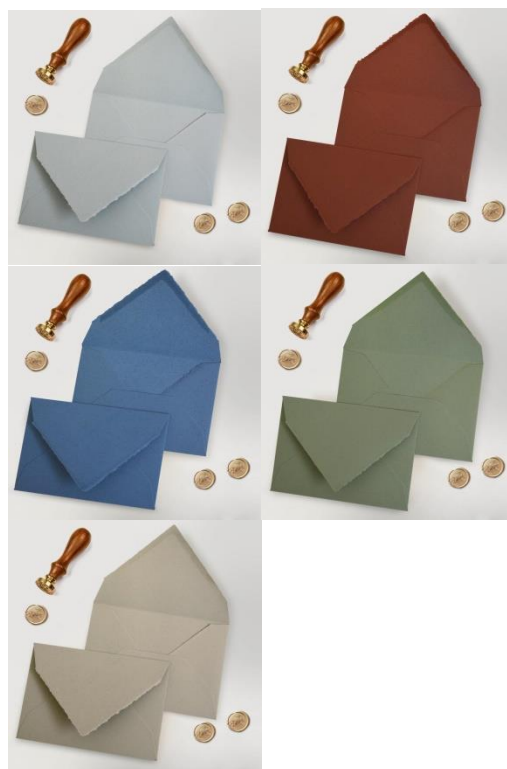
COLORI SPECIALI 2,70 MINIMO 50 PZ