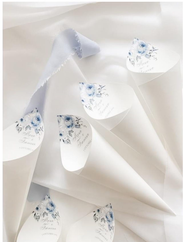
Cono porta riso 1,00