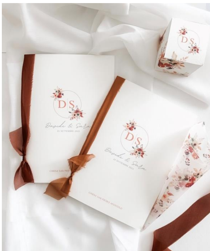
Libretto messa con seta 4,00