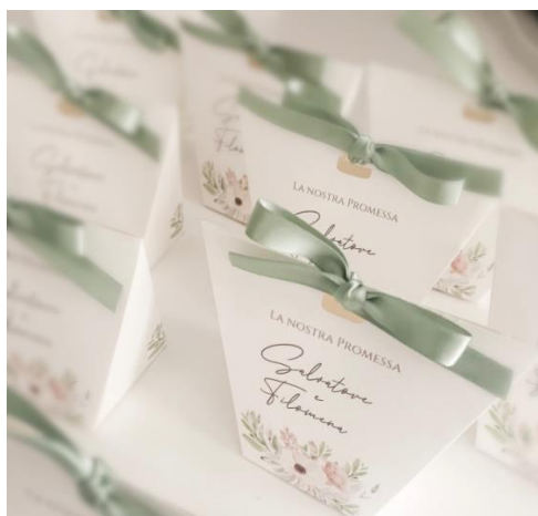
Bustina portaconfetti chiusa 1,50