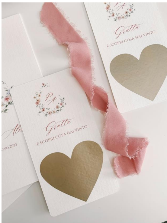
Gratta e vinci 2.00