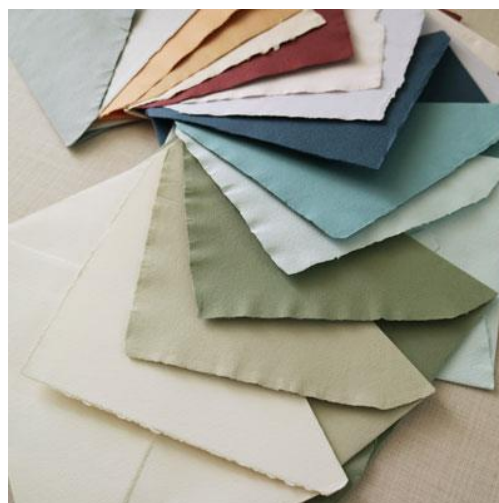
Busta IN CARTA COTONE COLORATA