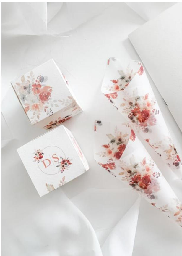
Cono vellum 0,80 scatolina cubo 2,00