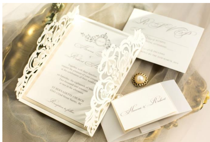
Modello rettangolare 2* 4.00