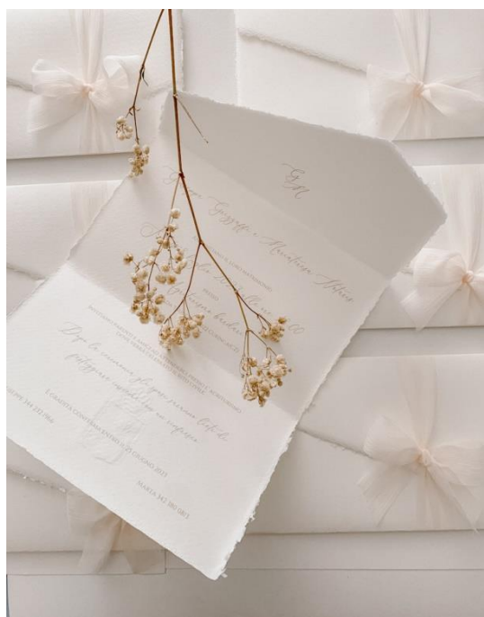
Modello a busta con chiusura in nastro di seta 4.00 €