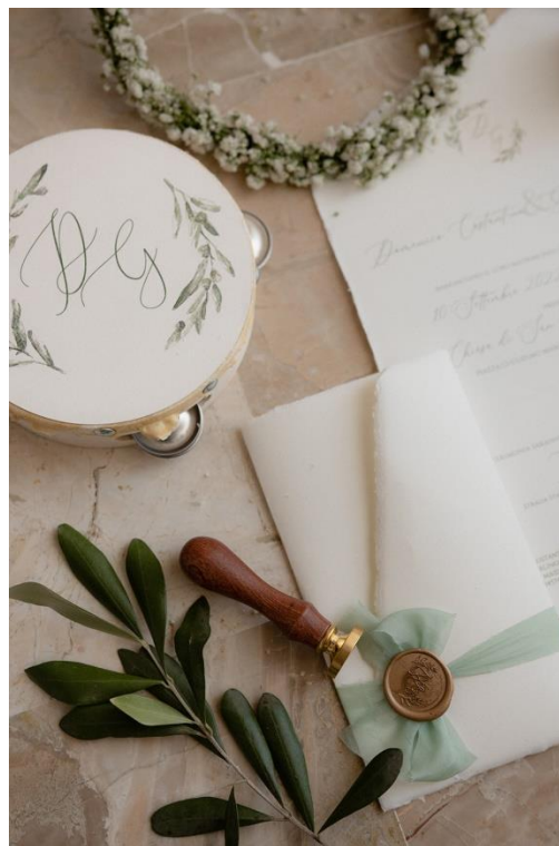
Aggiunta del sigillo in ceralacca +1.00

Inviti su misura realizzati negli anni, ma che potete comunque personalizzare a sua volta