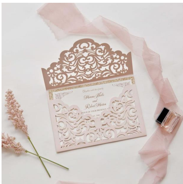
Modello rettangolare 8* 3,50