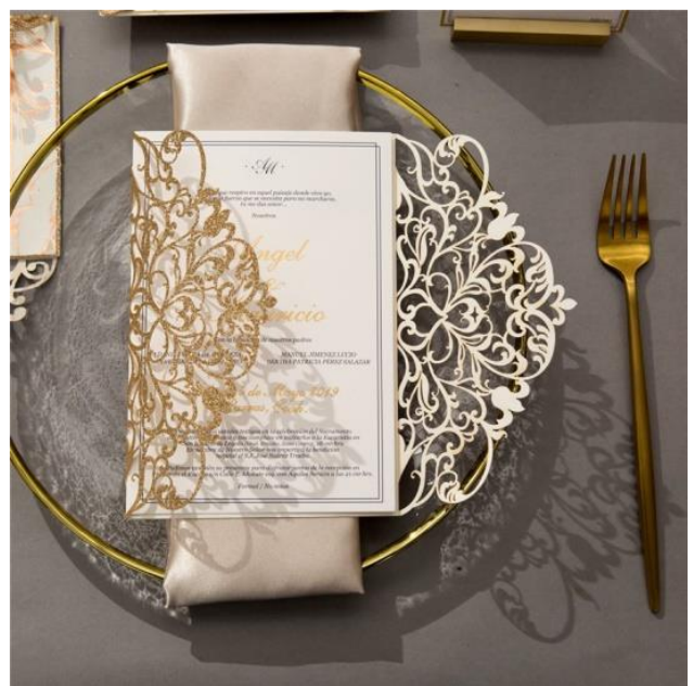
Modello rettangolare 10* 4.00