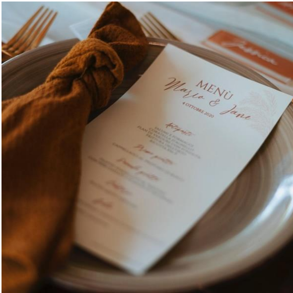
Menù posto singolo rettangolare 1,50 Stampa nome invitato su ogni menù + 0,20